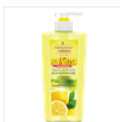
Жидкое мыло для рук кухонное Лимон «КУХНЯ РЕКОМЕНДУЕТ»